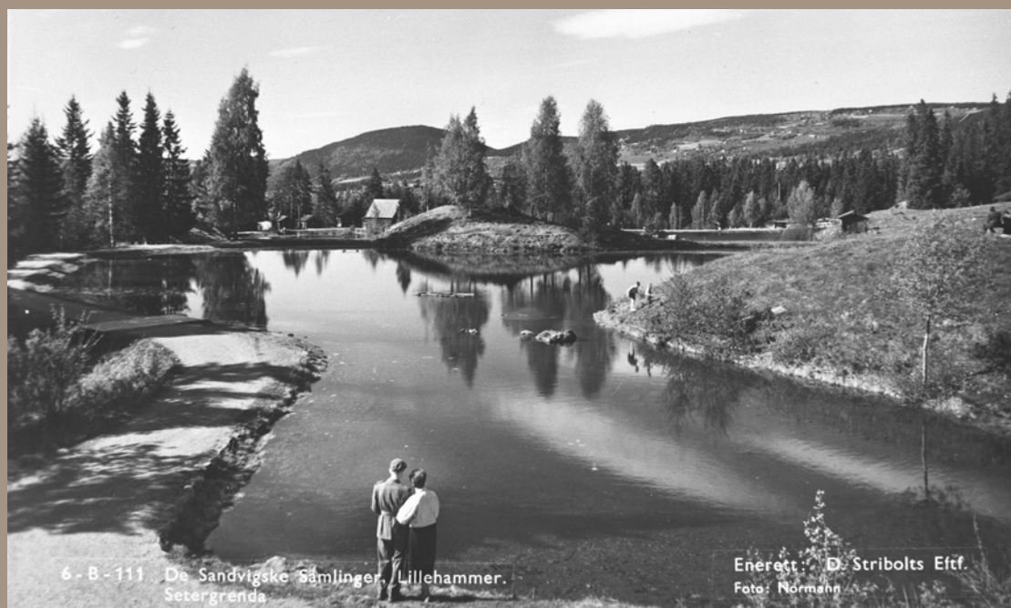
Lyarhaugen ca 1950. Vi har et bilde tatt 10–15 år senere som viser hvor fort trærne vokser til og omdanner et åpent fjell-landskap til skogtjernidyll. Det er vakkert, men kanskje ikke helt etter intensjonen.

Et annet og viktig poeng er at de store gamle trærne utgjør en sikkerhetsrisiko, både for besøkende og for våre hus. Hogsten vår er derfor helt nødvendig, tjener mange gode formål, og inngår som en helt naturlig del av vår virksomhet.